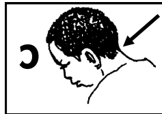
ɔ koti ukosi