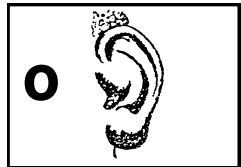
o koto sikio